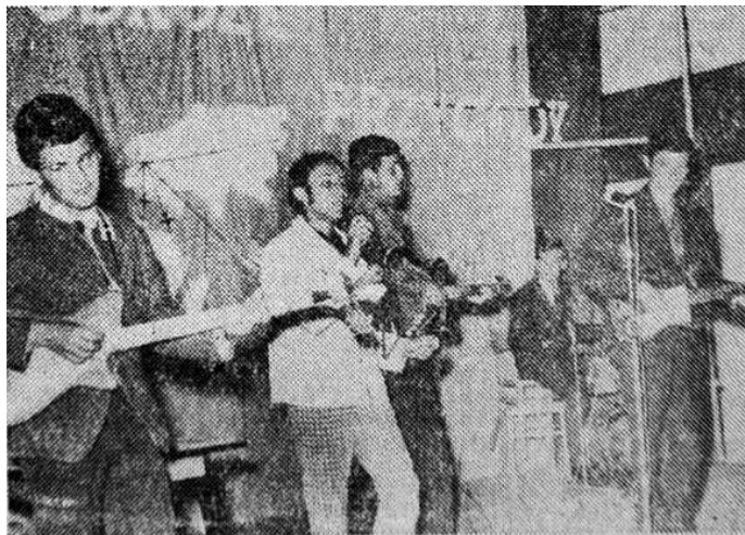
W części artystycznej „finału finałów” wystąpili soliści i zespół gitarowy z Domu Kultury Budowlanych. (Szczególnie polebało się zebranych widowisko pt. „Na krakowskim Rynku”).